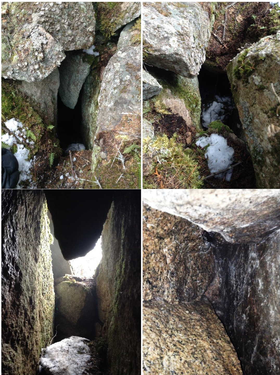
Annexe 1. Cavité au potentiel faible constituée de blocs de granite anguleux accumulés sous la barre rocheuse de la zone potentielle 1 (N48.4183° W70.7232°), hors de la zone d'influence révisée du projet de terminal maritime en Rive-Nord du Saguenay, région du Saguenay–Lac-Saint-Jean, Québec.