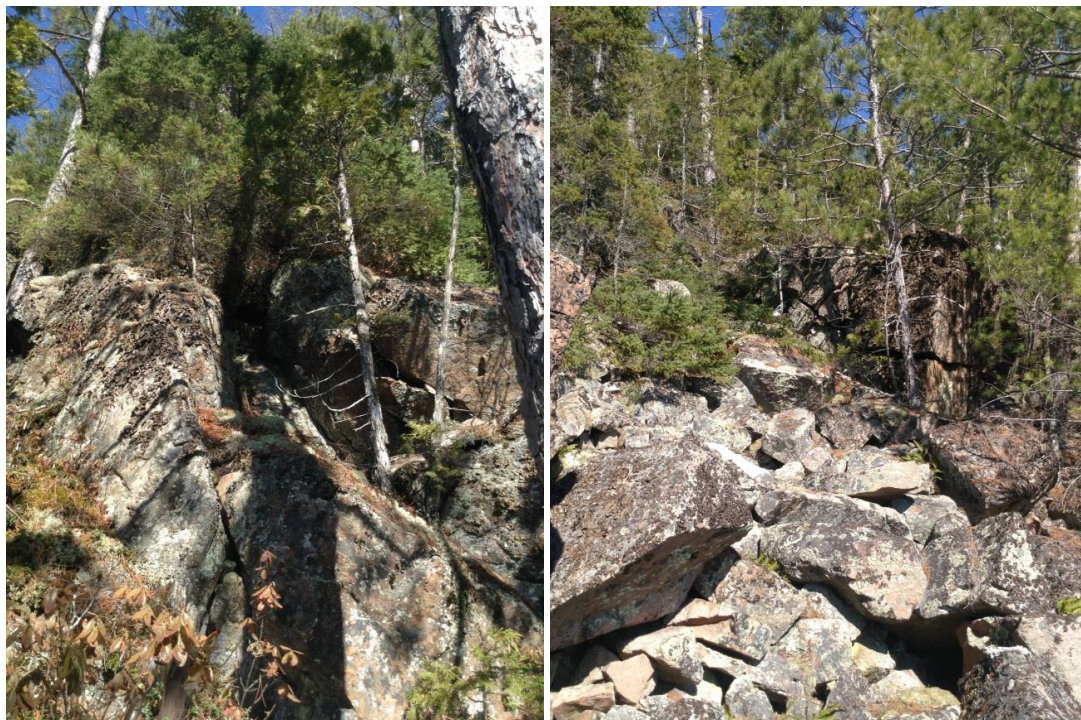
Annexe 8. Abris et fissures de roche sans aucun potentiel situées dans la zone potentielle 8 (N48.3918° W70.7134°), dans la zone d'influence révisée du projet de terminal maritime en Rive-Nord du Saguenay, région du Saguenay–Lac-Saint-Jean, Québec.