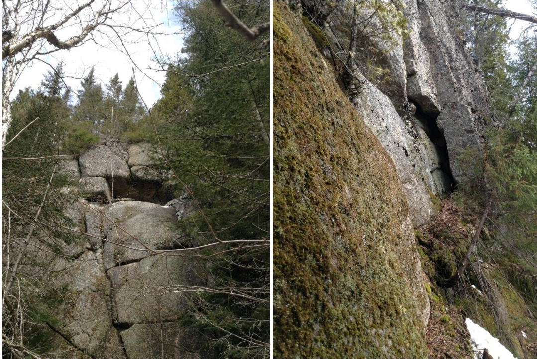
Annexe 2. Abris sous roche sans aucun potentiel situés dans la zone potentielle 1 (N48.4182° W70.7233°), hors de la zone d'influence révisée du projet de terminal maritime en Rive-Nord du Saguenay, région du Saguenay–Lac-Saint-Jean, Québec.