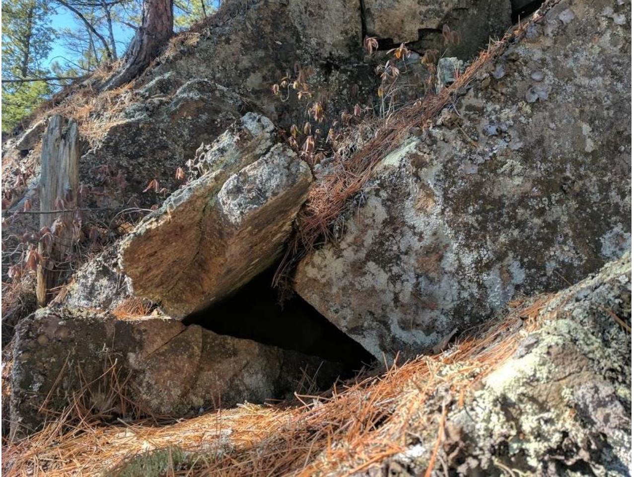
Annexe 5. Abris sous roche sans aucun potentiel situé dans la zone potentielle 5 (N48.3989° W70.7211°), dans la zone d'influence restreinte du projet de terminal maritime en Rive-Nord du Saguenay, région du Saguenay–Lac-Saint-Jean, Québec.