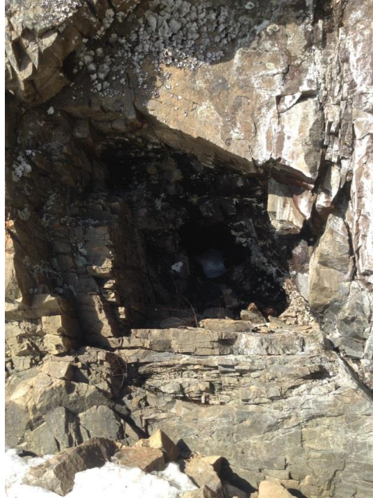
Annexe 10. Abris sous roche sans aucun potentiel située à proximité de la zone potentielle 10 (N48.3865° W70.7143°) hors de la zone d'influence révisée du projet de terminal maritime en Rive-Nord du Saguenay, région du Saguenay–Lac-Saint-Jean, Québec.