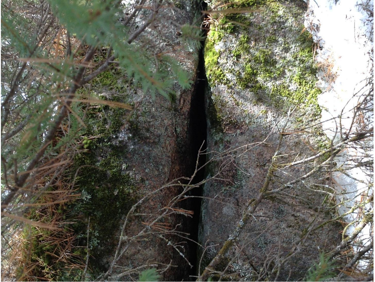
Annexe 4. Fissure de roche sans aucun potentiel situé dans la zone potentielle 3 (N48.4136° W70.7191°), dans la zone d'influence révisée du projet de terminal maritime en Rive-Nord du Saguenay, région du Saguenay–Lac-Saint-Jean, Québec.