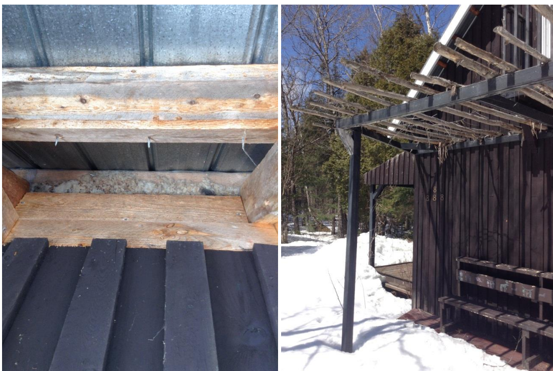
Annexe 12. Exemple d'un chalet (N48.3876° W70.7057°) visité durant la phase de recherche d'hibernacles afin de déceler la présence d'une colonie de chiroptères à partir des dépôts de guano. Aucun passage dans la toiture, sous l'entretoit ou l'habillage extérieur du chalet permettant le passage de chiroptères n'a été observé. Les sections sous l'entretoit au niveau des solives du plafond ont été grillagées.