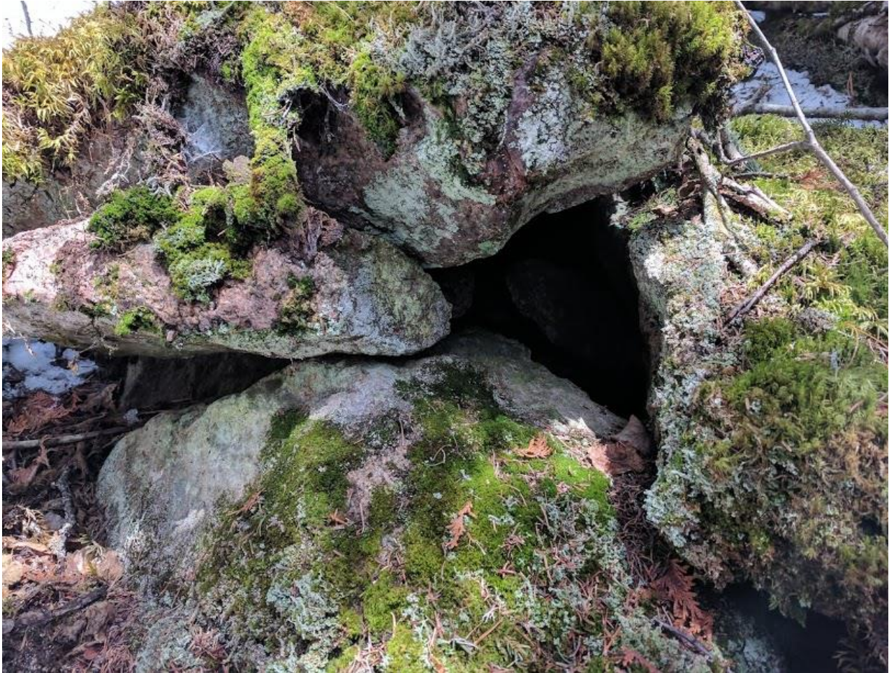
Annexe 3. Abris sous roche sans aucun potentiel situé dans la zone potentielle 2 (N48.4186° W70.7158°), dans la zone d'influence révisée du projet de terminal maritime en Rive-Nord du Saguenay, région du Saguenay–Lac-Saint-Jean, Québec.