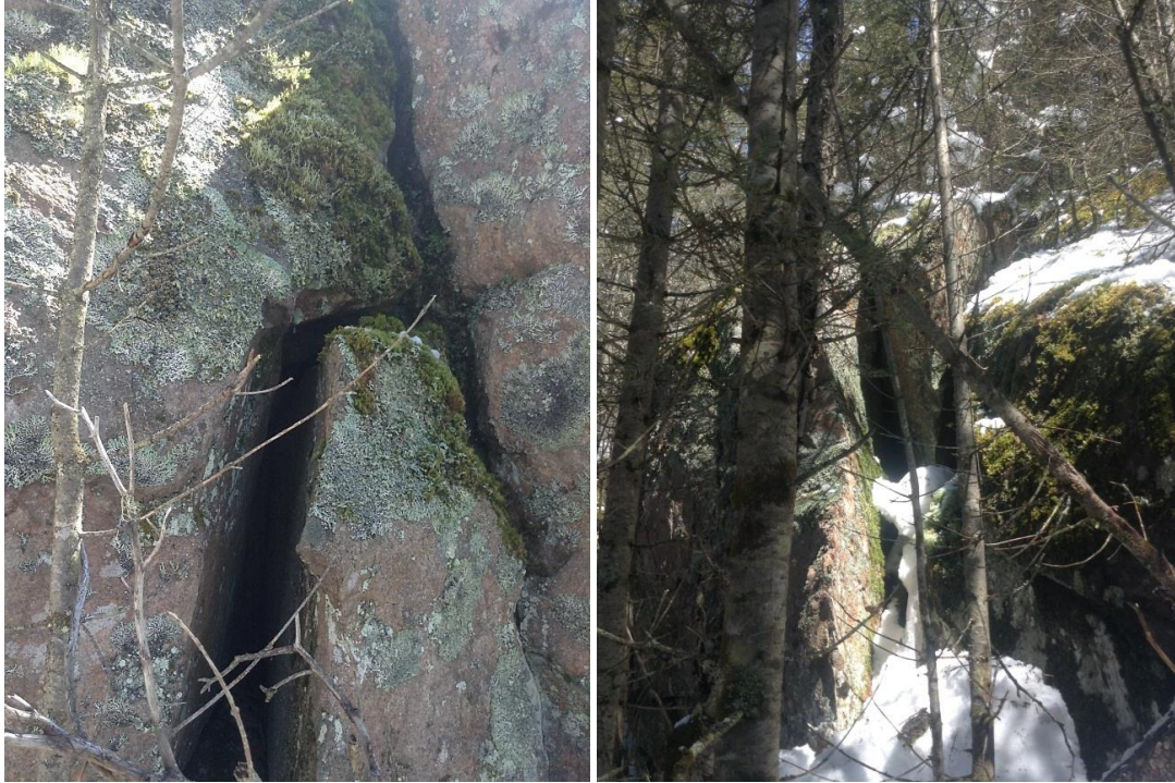
Annexe 9. Fissure de roche sans aucun potentiel située dans la zone potentielle 9 (N48.3951° W70.7091°), dans la zone d'influence révisée du projet de terminal maritime en Rive-Nord du Saguenay, région du Saguenay–Lac-Saint-Jean, Québec.