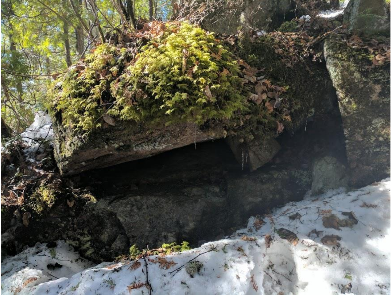
Annexe 6. Abris sous roche sans aucun potentiel situé dans la zone potentielle 6 (N48.3966° W70.7193°), dans la zone d'influence restreinte du projet de terminal maritime en Rive-Nord du Saguenay, région du Saguenay–Lac-Saint-Jean, Québec.