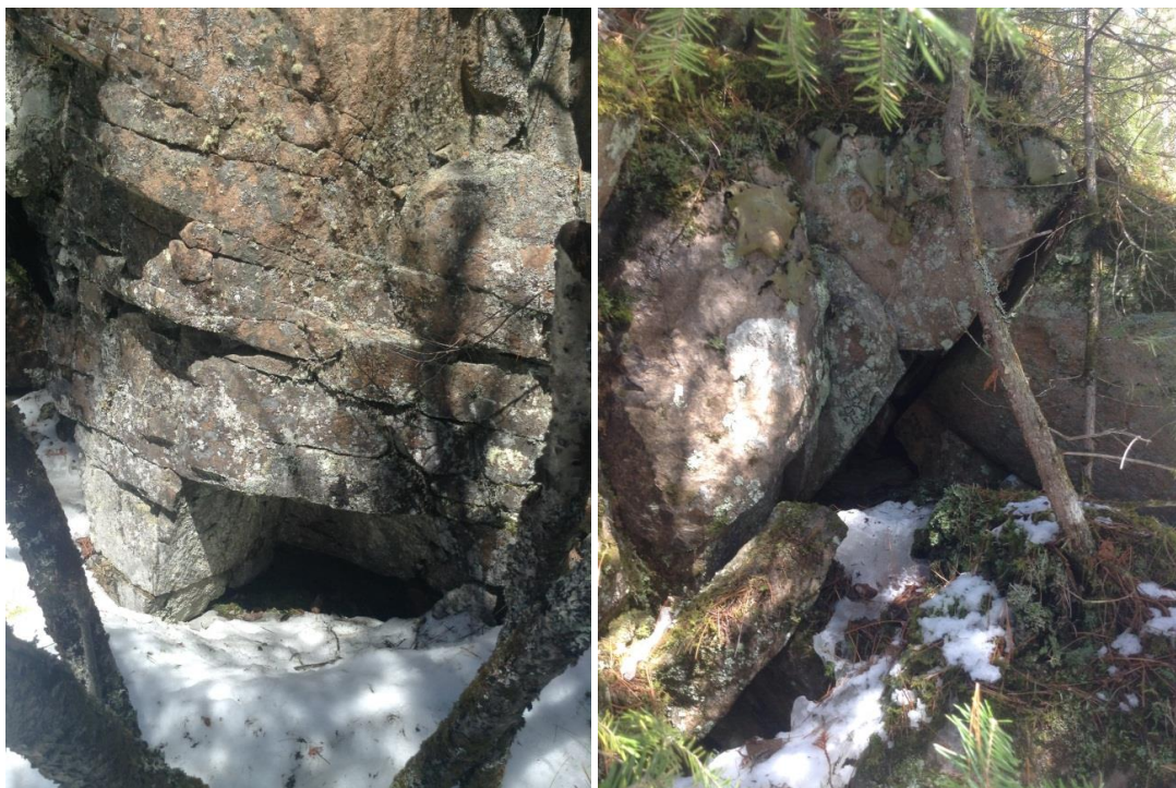
Annexe 11. Abris et fissures de roche sans aucun potentiel située dans la zone potentielle 11 (N48.3903° W70.7044°), hors de la zone d'influence révisée du projet de terminal maritime en Rive-Nord du Saguenay, région du Saguenay–Lac-Saint-Jean, Québec.