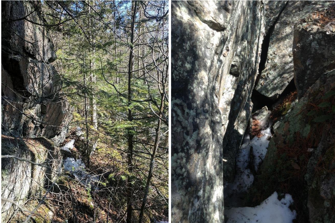
Annexe 7. Fissures de roche sans aucun potentiel situées dans la zone potentielle 7 (N48.3947° W70.7165°), dans la zone d'influence restreinte du projet de terminal maritime en Rive-Nord du Saguenay, région du Saguenay–Lac-Saint-Jean, Québec.